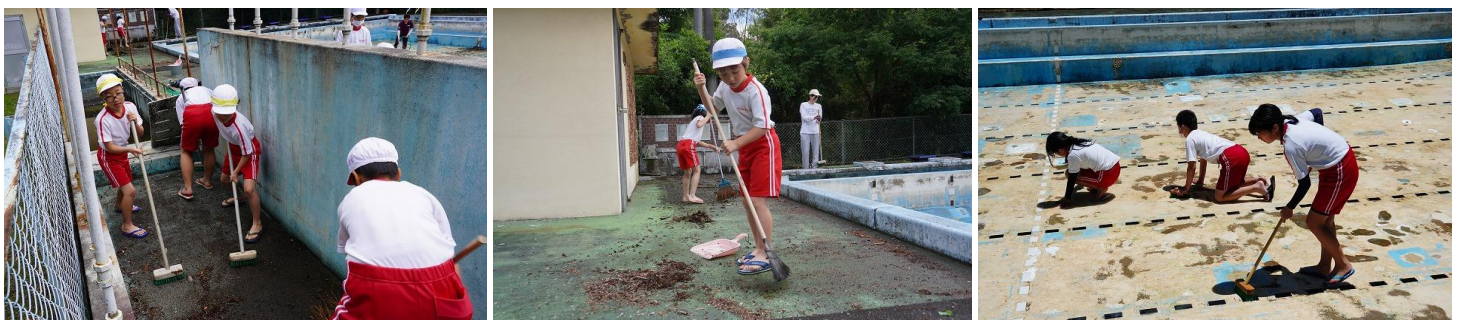
今年もフールの季節がやってきました。みんなできれいに掃除をしました！