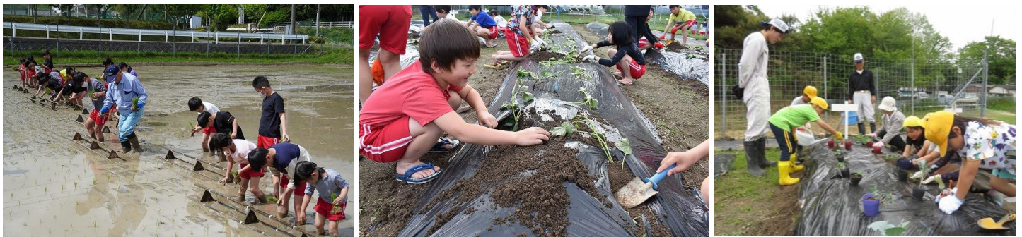
サポーターの皆さまにお世話になり、田植え・サツマイモ植え・各学年の畑の整備ができました。