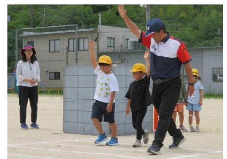
交通安全教室：日本自動車連盟 JAF 様